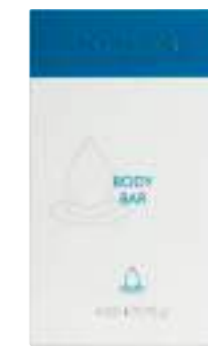
BODY BAR BARRA LIMPIADORA SIN JABÓN 100 G

Liquid Body Bar es una experiencia sensorial completa. Su fragante aroma a pomelo refresca los sentidos y huele de maravilla.