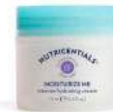
MOISTURIZE ME INTENSE HYDRATING CREAM CREMA FACIAL HIDRATANTE INTENSA 75 ML