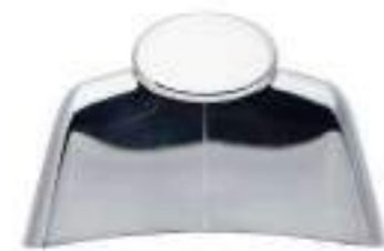
GALVANIC SPA FOCUS AREA CONDUCTOR FOCUS AREA CONDUCTOR