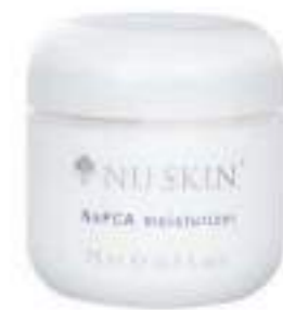
NAPCA MOISTURIZER CREMA FACIAL HIDRATANTE 75 ML

No hay mejor sensación que un toque de la refrescante Moisture Mist en un día de calor. Gracias a sus ingredientes naturales que retienen la humedad, como el PCA sódico, basta con una pulverización para conseguir una piel suave y flexible.