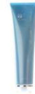
BODY SHAPING GEL GEL MOLDEADOR CORPORAL 150 ML