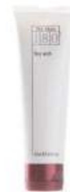
180° FACE WASH GEL ANTIEDAD PARA EL ROSTRO 125 ML

La fórmula contiene un 10 % de vitamina C activa y de flujo libre para reducir el aspecto de las líneas de expresión y las arrugas y hace de 180° Face Wash un limpiador antiedad único y extraordinario. Su fórmula rica y cremosa combate el aspecto de las manchas de la edad y el tono desigual, y ayuda a mantener la piel firme para proporcionar un rostro fresco y de aspecto joven.