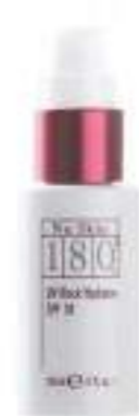
180° UV BLOCK HYDRATOR SPF 18 CREMA ANTIEDAD DE DÍA 30 ML