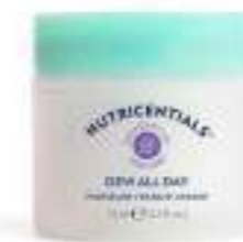
DEW ALL DAY MOISTURE RESTORE CREAM CREMA FACIAL HIDRATANTE INTENSA 75 ML