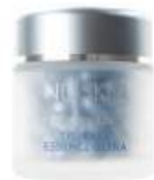
AGELOC TRU FACE ESSENCE ULTRA SÉRUM FACIAL REAFIRMANTE 60 CÁPSULAS

ageLOC Tru Face Essence Ultra es la mejor solución de Nu Skin para reafirmar tu piel. Su increíble fórmula combina nuestra exclusiva tecnología Tru Face FirmPlex, científicamente probada, que proporciona una piel visiblemente más firme, y nuestra famosa ciencia del ageLOC Me para acabar con los signos visibles del envejecimiento de la piel desde su origen. Este sérum también protege la piel frente a los efectos negativos del estrés oxidativo. Cada cápsula contiene un gran potencial para tu piel.