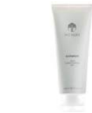
ENHANCER GEL FACIAL CALMANTE E HIDRATANTE 100 ML

Cuando hablamos del cuidado de la piel, todos necesitamos algo distinto, y lo mismo sucede en materia de hidratación. Nuestros productos Nu Skin Heritage cubren las necesidades de hidratación de tu piel, ya necesite una hidratación ligera, profunda o media. Independientemente de lo que necesites, solo tienes que añadirlo a tu rutina diaria para ayudar a mantener una piel hidratada y con un aspecto sano.