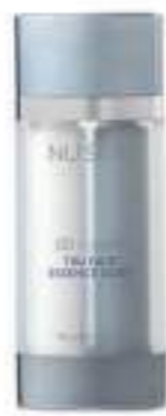
AGELOC TRU FACE ESSENCE DUET CREMA Y SÉRUM PARA CUELLO Y ESCOTE 2X15 ML

¿Por qué ageLOC Tru Face Essence Ultra es tan bueno? Gracias a nuestros esfuerzos por ofrecerte el mejor producto posible y a la actualización frecuente de su fórmula desde su lanzamiento como Tru Face Essence en 2003.