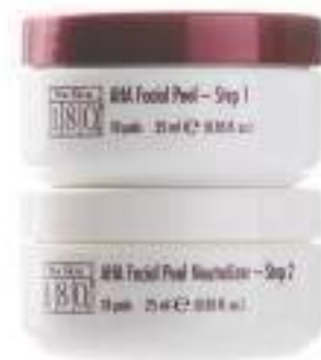
180° AHA FACIAL PEEL AND NEUTRALIZER EXFOLIANTE ANTIEDAD PARA EL ROSTRO 25 ML