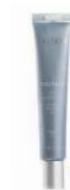
LINE CORRECTOR GEL FACIAL REDUCTOR DE LÍNEAS Y ARRUGAS 30 ML

La disponibilidad de algunos productos puede variar según el país. Para comprobar la disponibilidad, consulta la lista de precios o visita www.nuskin.com