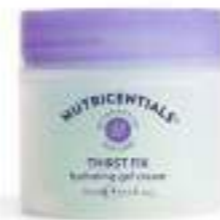
THRIST FIX HYDRATING GEL CREAM GEL FACIAL HIDRATANTE LIGERO 75 ML