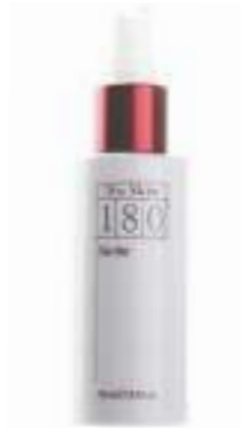
180° SKIN MIST MATIZADOR ANTIEDAD PARA EL ROSTRO 100 ML

La disponibilidad de algunos productos puede variar según el país. Para comprobar la disponibilidad, consulta la lista de precios o visita www.nuskin.com