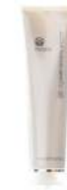
DERMATIC EFFECTS LOCIÓN MOLDEADORA CORPORAL 150 ML