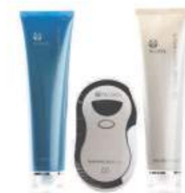
GALVANIC BODY TRIO TRIO ANTIEDAD REAFIRMANTE