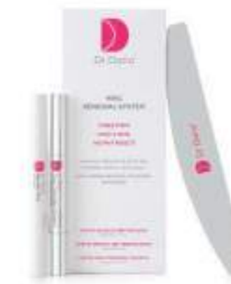
NAIL RENEWAL SYSTEM KIT PARA EXFOLIAR E HIDRATAR LAS UÑAS

Como en el paso 01, da varias vueltas al bolígrafo plateado y aplica el producto en toda la uña, sin olvidarte de mimar la piel de alrededor y las cutículas. Repite este paso las veces que quieras durante la semana (pero no más de una vez al día).