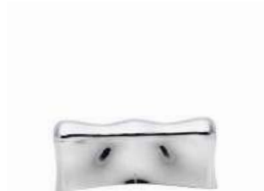
GALVANIC SPA BODY CONDUCTOR BODY CONDUCTOR