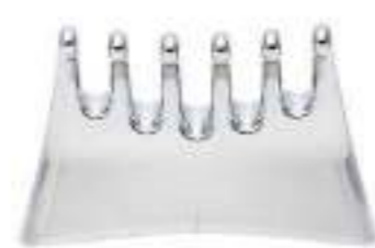
GALVANIC SPA SCALP CONDUCTOR SCALP CONDUCTOR